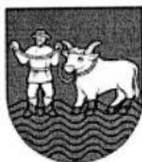
Erb obce :