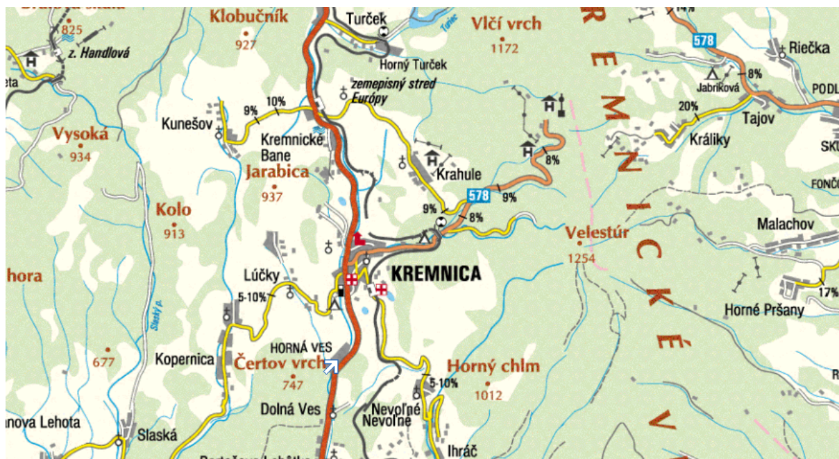
Obrázok: Poloha obce v rámci mikroregiónu „Kremnica a okolie“

V roku 1985 bola obec vyhlásená za oblasť sústredeného cestovného ruchu. V súčasnosti sa Krahule stávajú významným strediskom turistického ruchu, rekreácie a oddychu počas celého roka. Zimné športovanie sa sústreďuje priamo v obci, kde je vybudovaná štvorsedačková lanovka , lyžiarska zjazdovka je zabezpečená aj technickým snehom a v obci sú vybudované zariadenia pre ubytovanie návštevníkov obce.