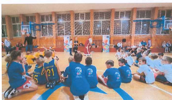
Mikuláš v basketbalovom klube BSC Bratislava, v dňoch 4.12., 7.12. a 11.12.2022, v športovej hale a na ZŠ Holíčska