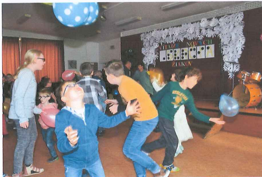
Privítanie nových žiakov na ZŠ pre zrakovo postihnuté deti Svrčia 6, v školskom roku 2022-23, dňa 5.10.2022