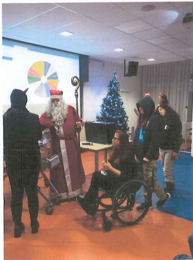
Mikuláš na Strednej odbornej škole pre žiakov s telesným postihnutím, Mokrohajská 1, dňa 6.12.2022