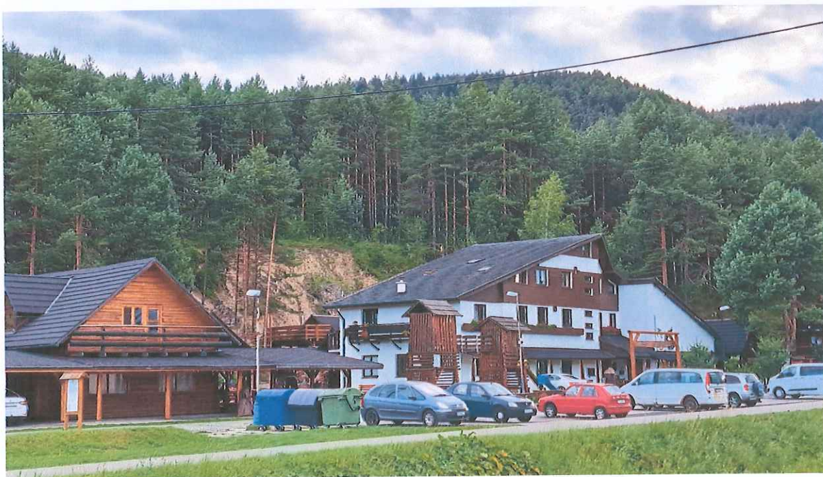
Sústredenie detí basketbalového klubu BSC Bratislava vo Svite, v dňoch 29.8.-3.9.2022