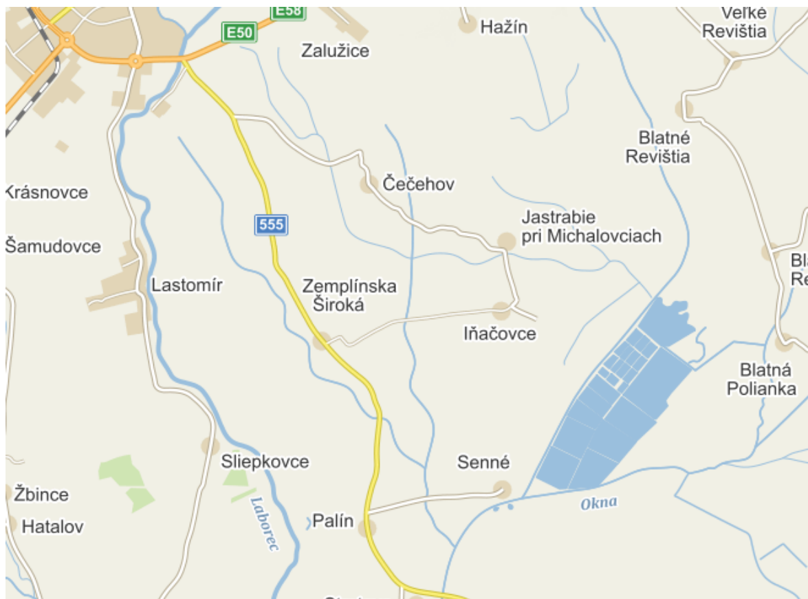
Obrázok 1 Mapa polohy obce

Nadmorská výška : Obec sa rozprestiera v nadmorskej výške 108 m. n. m.