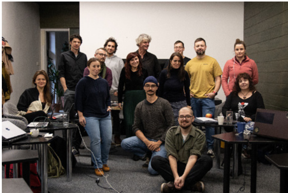
Účastníci workshopu z krajín V4.