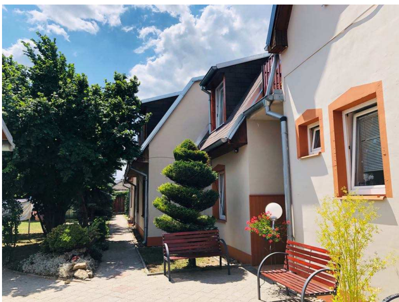
Obrázok 1 Vonkajšie priestory ZpS

V areáli objektu sa nachádza veľká záhrada so štyrmi altánkami a okrasnými drevinami, kde môžu klienti tráviť voľný čas, resp. stretávať sa nerušene s príbuznými a priateľmi. Záhrada je vybavená stoličkami a stolmi, dvoma hojdačkami pre štyri osoby. V záhrade je možné usporiadať spoločenské akcie ako grilovanie, koncerty a pod.