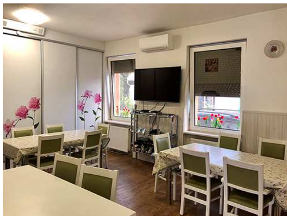
Obrázok 3 Jedáleň ZpS

stravujú na izbách, resp. v druhom turnuse v jedálni. V čase medzi podávaním jedál sa jedáleň využíva na rôzne aktivity pre PSS, organizovanie spoločenských udalostí, jubileí a pod.