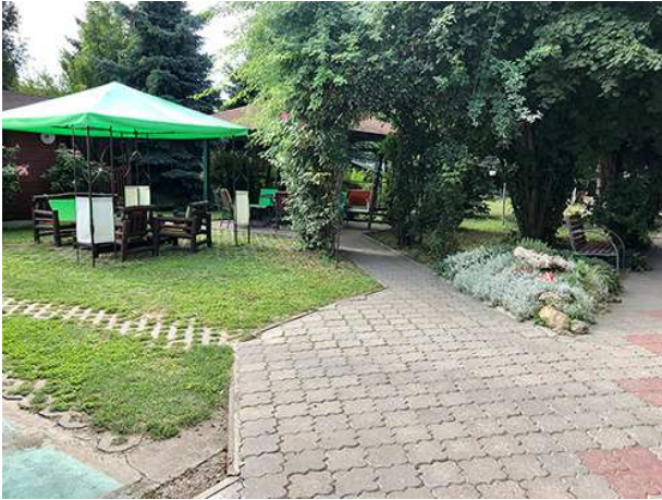
Obrázok 2 Záhrada ZpS

Ubytovanie je poskytované v dvojposteľových alebo trojposteľových izbách. Dve alebo tri izby tvoria bunku, pričom každá bunka je vybavená kúpeľňou a samostatnou toaletou.