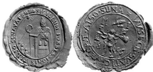
Obecné pečate z 19.storočia