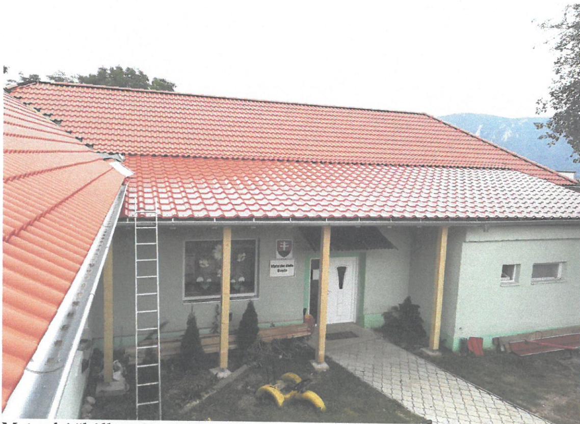
Materská škôlka v Kružnej