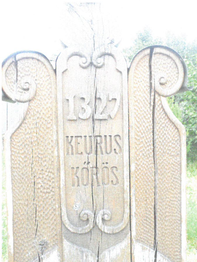
Pamätný stĺp v obci Kružná