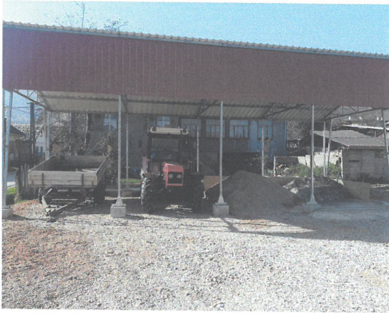
Parkovisko pre obecný traktor a autobus