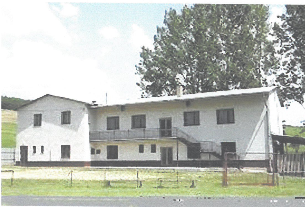
Kultúrny dom v obci Kružná

Kultúrny dom v Kružnej bol skolaudovaný v roku 2000 pri príležitosti I. Dňa obce.