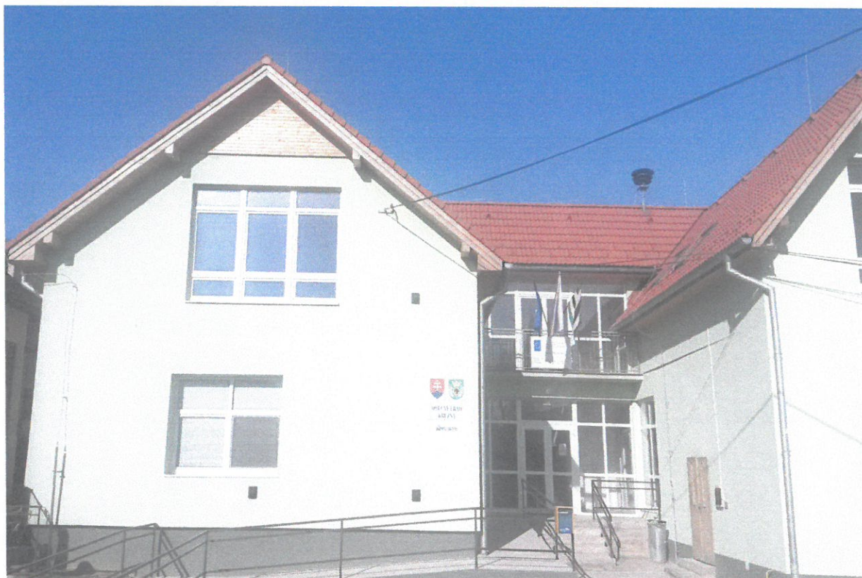
Obecný úrad v Kružnej

V súčasnosti v budove na prízemí sídli obecný úrad, a na poschodí je vytvorená remeselnícka izba a zariadená knižnica.