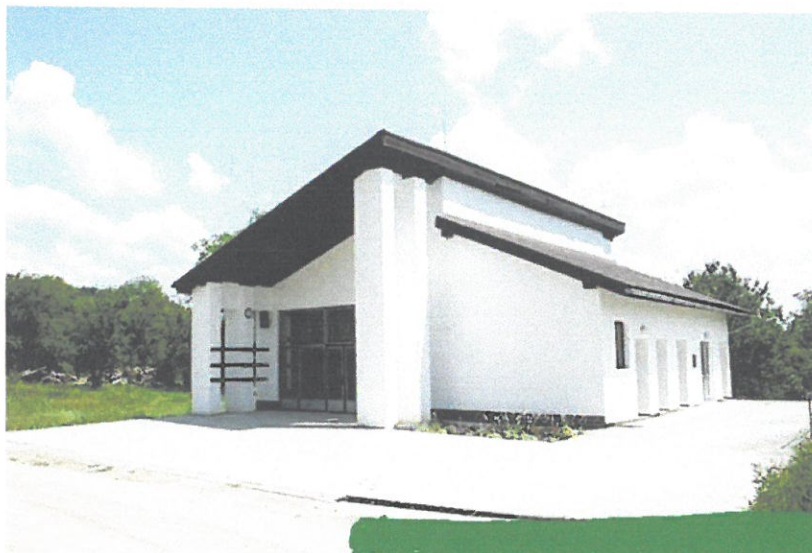
Dom smútku v obci Kružná

Z novších stavieb občanom slúžia budova kultúrneho domu a dom smútku. Stavba Domu smútku bola začatá v roku 1995. Dom smútku bol uvedený do prevádzky len v roku 1998. Kolaudácia stavby bola v roku 2009. Slávnostné odovzdanie Domu smútku do užívania sa uskutočnilo dňa 1. augusta 2009 pri príležitosti V. Dňa obce Kružná.