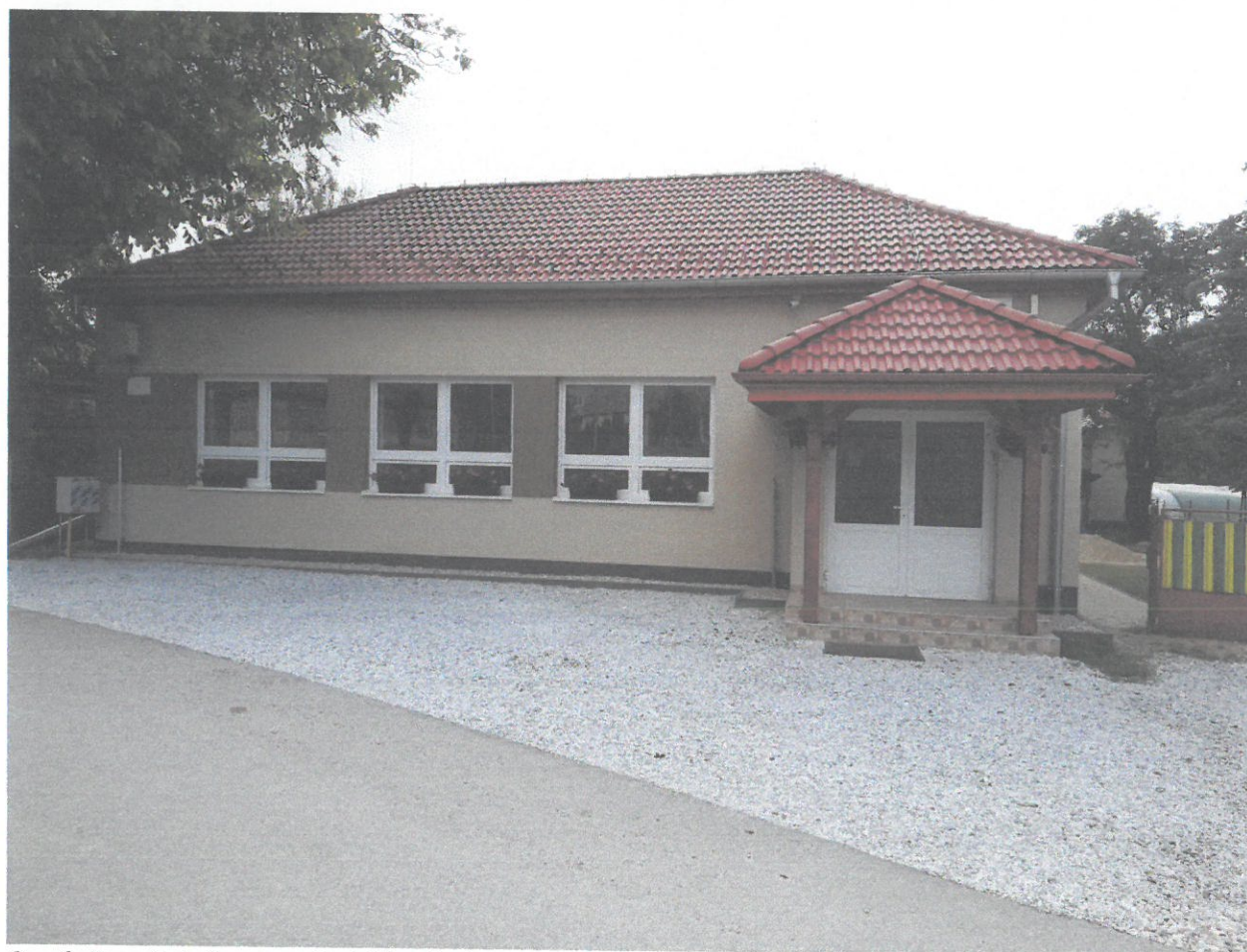
Spoločenský dom v obci Kružná