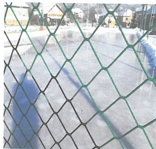
Detské ihrisko s hracími prvkami a multifunkčné ihrisko s umelým trávnikom na futbal, nohejbal a volejbal a v zime na korčuľovanie a na hokej.