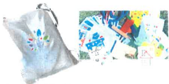
IncluDidActive Predškolský balíček

na slovenské curriculum, pedagóg so zameraním na medzinárodné curriculum, školský logopéd, školský psychológ, detský psychológ a fyzioterapeut, ktorí majú dlhoročné skúsenosti s rôznymi typmi a variáciami pomôcok, ktoré používajú napríklad pri odstraňovaní rečových porúch, alebo pri zlepšovaní komunikačných schopností detí a mládeže. Aj deti s poruchami spektra, správania, alebo s poruchami učenia potrebujú pomôcky navrhnuté a odskúšané