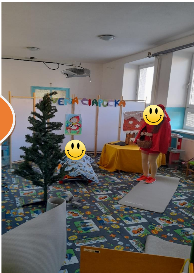
Divadlo v podaní pedagógov: ČERVENÁ ČIAPOČKA