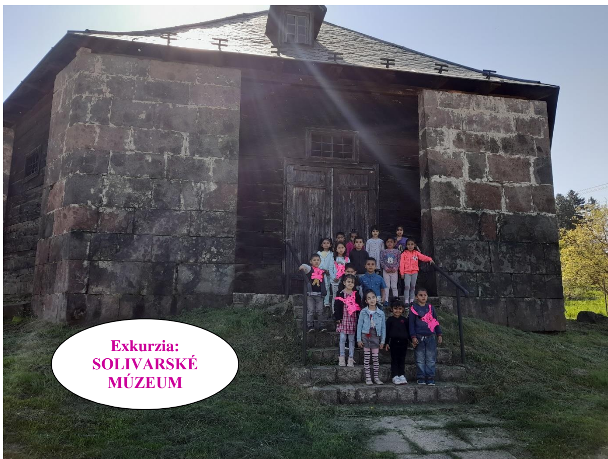
Exkurzia: SOLIVARSKÉ MÚZEUM