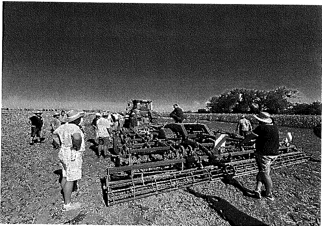
Oficiálny zástupca značky MZURI: