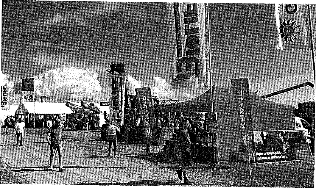
Školenie LEMKEN, dňa 17.08.2022: