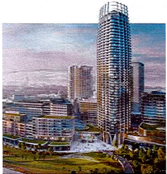
Pribinova Y – administratívna budova