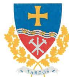
Tardos Maďarská republika