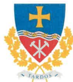
Tardos Maďarská republika