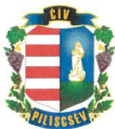
Piliscsév Maďarská republika