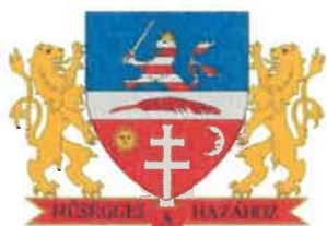
Bonyhád Maďarská republika