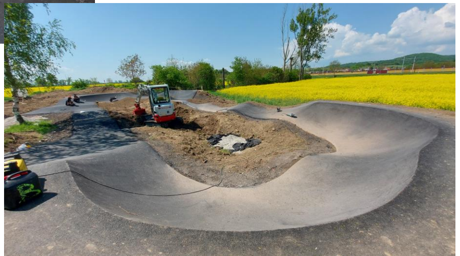
Pumptracková dráha