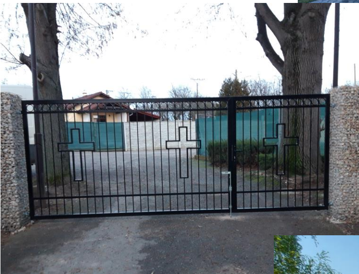
Oplotenie na cintoríne