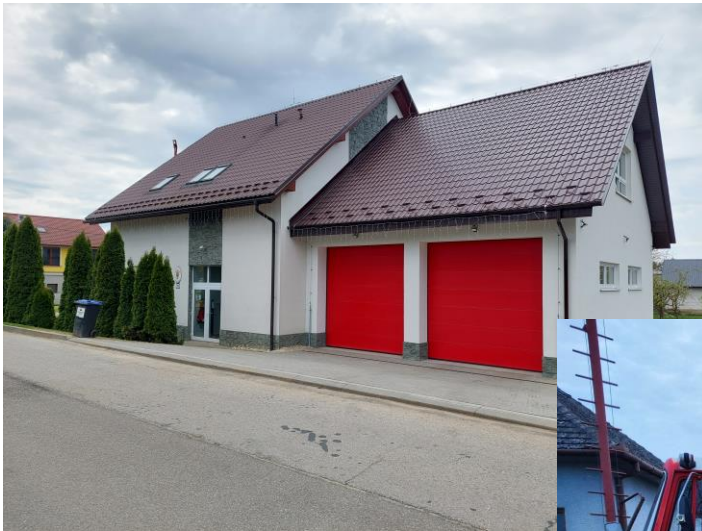
Prístavba Hasičskej zbrojnice