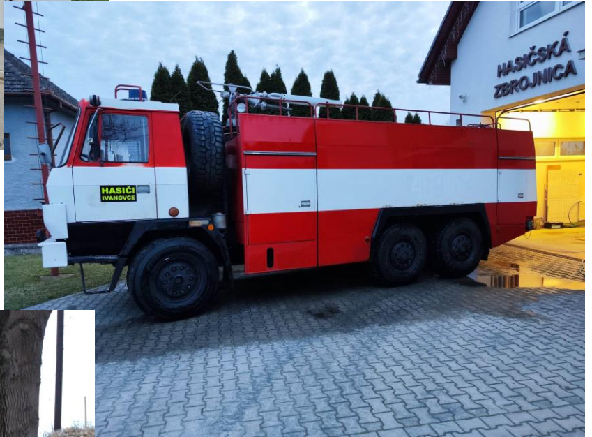
Hasičské vozidlo