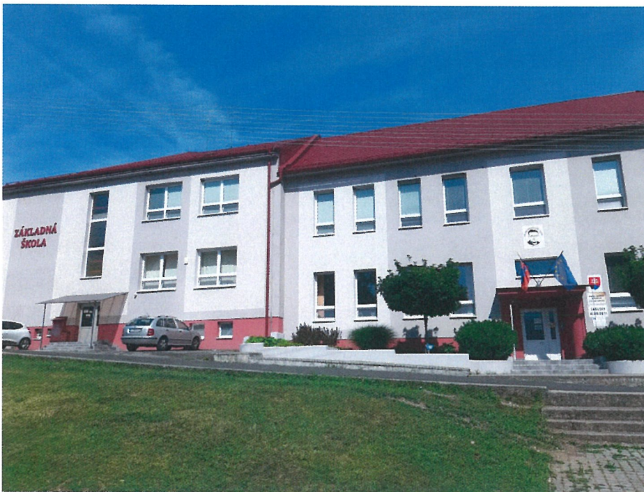
Budova Základnej školy Štefana Senčička Starý Tekov

Na základe analýzy doterajšieho vývoja možno očakávať, že rozvoj vzdelávania sa bude orientovať na základné vzdelávanie a predškolskú výchovu.