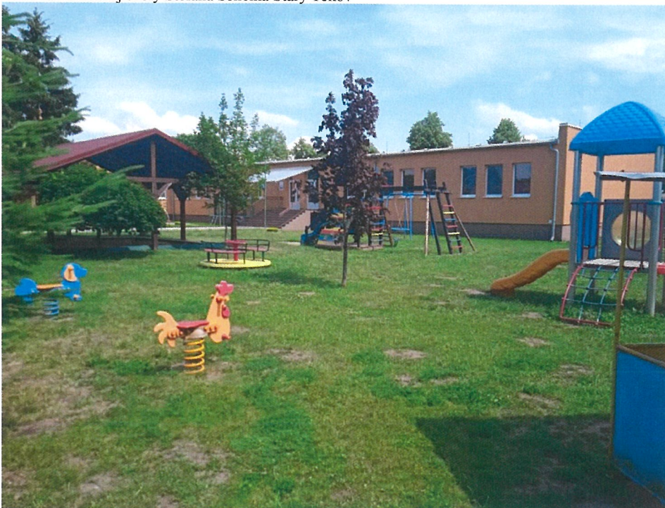
Budova Materskej školy Starý Tekov