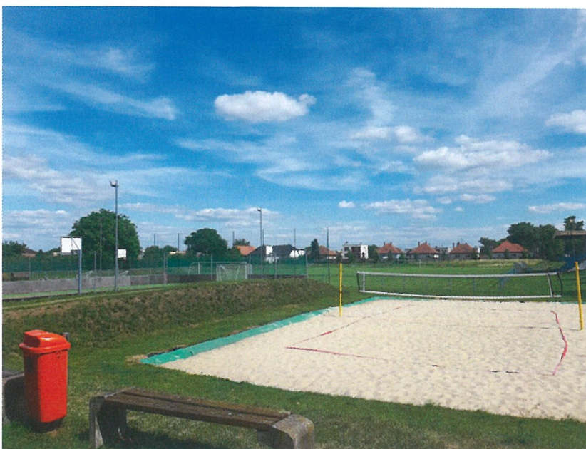
Športový areál – beachvolejbalové ihrisko