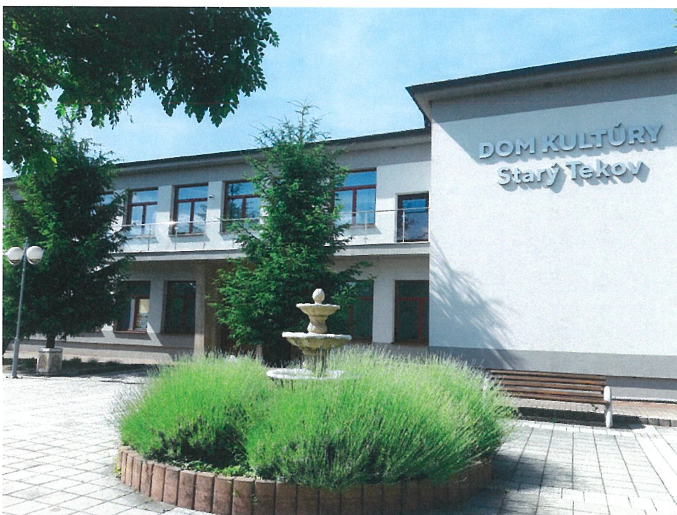
Budova Domu kultúry Starý Tekov

Na základe analýzy doterajšieho vývoja možno očakávať, že kultúrny, športový a spoločenský život bude pokračovať v doterajšom trende s možnosťou ďalšieho rozvoja .