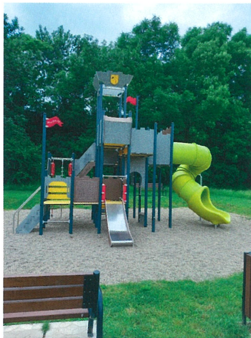
Detské ihrisko – Hrad s tobogánom pri Mlyne