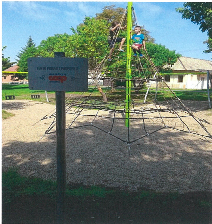
Detské ihrisko na námestí v parku 9.mája