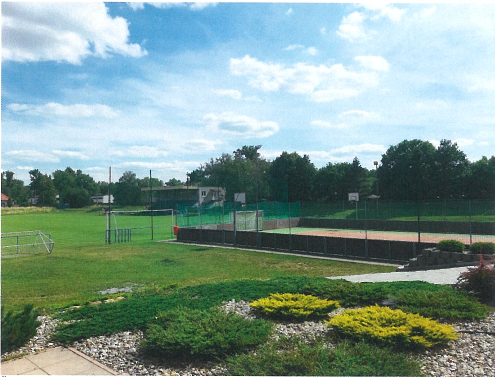
Športový areál – futbalové ihrisko, vpravo multifunkčné ihrisko