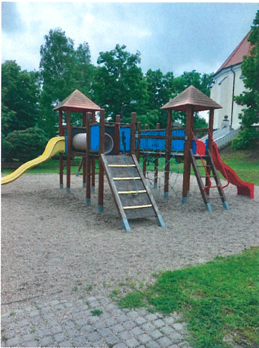
Detské ihrisko s preliezkami pri ZŠ