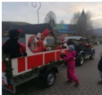
Stretnutie s Mikulášom

Deň detí, Pochod občanov v prírode, Dubovickí jurmak, Športový deň, Úcta k starším, a víťanie nového roka.