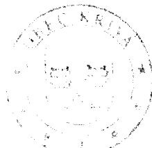
Súčasná pečať obce

Pečať obce je po obsahovej stránke celkom jedinečná. I keď zo Slovenska poznáme množstvo pečatí s motívmi stromov, takáto kompozícia sa nevyskytuje nikde inde. Na Orave majú ihličnaté stromy vo svojich erboch aj iné obce. Vo viacerých prípadoch sú stromy komponované v trojici na spôsob Golgoty. Táto myšlienka je mimoriadne vhodne riešená