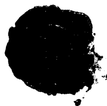
Odtlačok tpytania z r. 1859