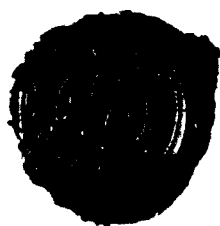
Odtlačok obecného pečatidla z r. 1842