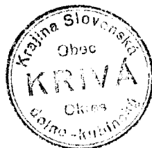
Odtlačok pečate obce z r. 1935