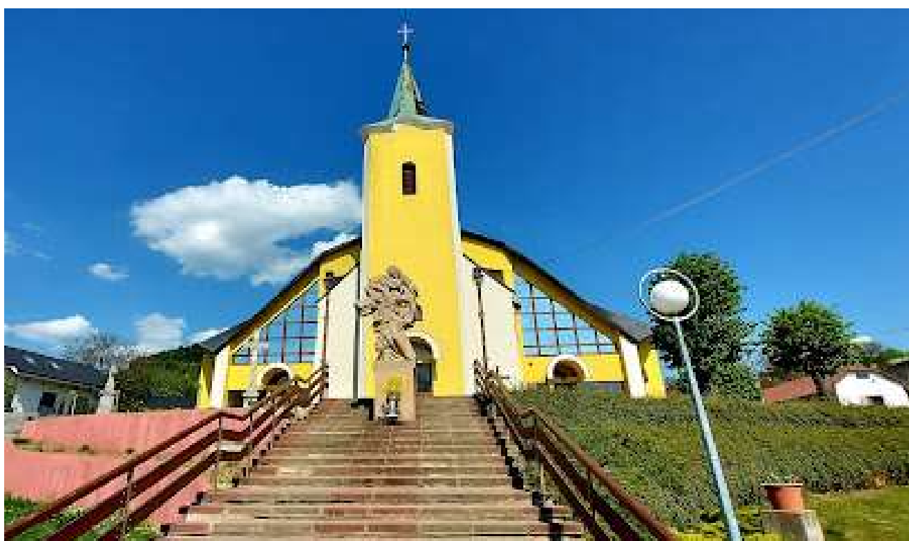
Pohľad na hradný kopec a kostol Všetkých svätých