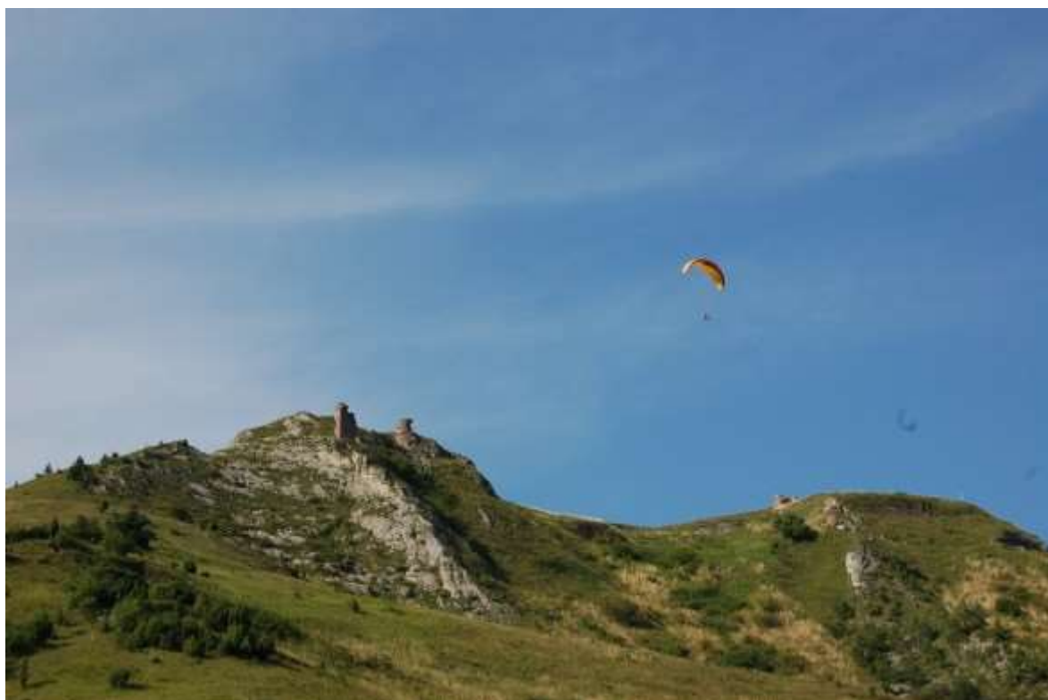
Pohľad na kostol Všetkých svätých