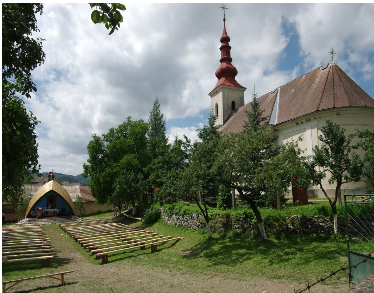
Kostol Karmel'skej P. Márie katolícky, prestavaný v roku 1672, ktorý pochádzal z roku 1428,

Rímskokatolícky kostol Panny Márie Karmel'skej, jednolod'ová neskorobaroková stavba so segmentovým ukončením presbytéria a vežou tvoriacou súčasť jej hmoty z roku 1759. Vznikol na mieste stredovekej stavby z roku 1482. Kostol prešiel úpravami v roku 1896. Na hlavnom klasicistickom oltári sa nachádza starší barokový obraz Panny Márie zo začiatku 18. storočia. Fasády kostola sú členené lizénami a polkruhovo ukončenými oknami. Veža vystupujúca z priečelia vo forme rizalitu, je lemovaná lizénami a ukončená barokovou helmicou s laternou. Najstarší z troch zvonov v kostole pochádza z roku 1635