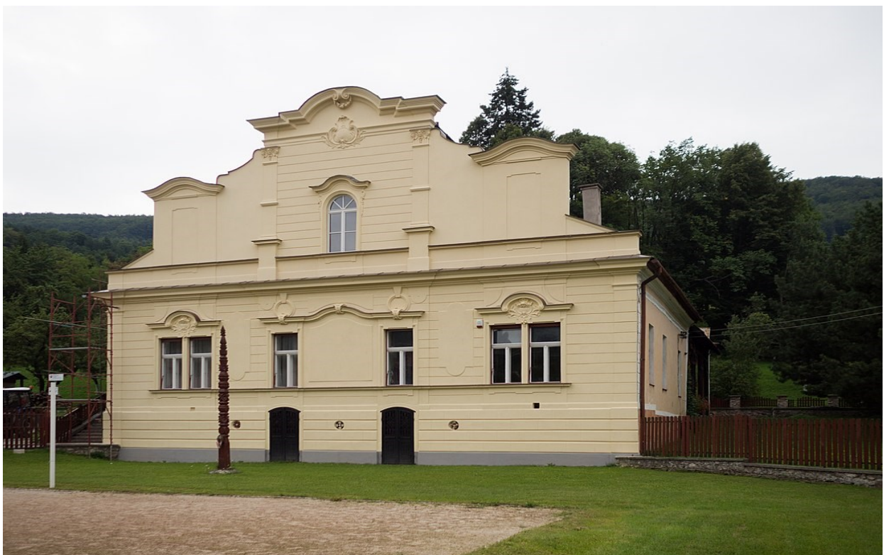
Kaštieľ neobarokový, prestavaný koncom 19. Storočia, pochádzajúci z 2. Polovice 18. storočia

Kaštieľ Imricha Károliho, jednopodlažná neobaroková stavba na pôdoryse písmena T z konca 19. storočia. Nachádza sa mieste staršej stavby z 18. storočia, ktorá bola do hmoty kaštieľa začlenená. Priečeliu kaštieľa dominuje prevýšený štít so štukatúrami a prelamanou rímsou. Fasáda je lemovaná pilastrami, pásovaním a oknami s bohatými nadokennými frontónmi.