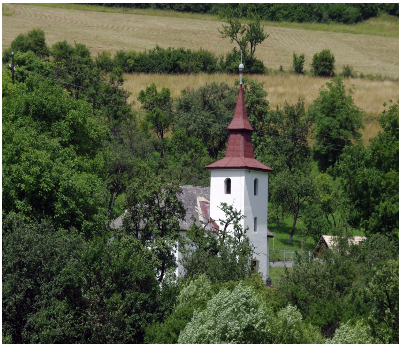
Kostol Reformovaný postavený po roku 1794 a dokončený vežou r. 1804.

Reformovaný kostol, jednolod'ová klasicistická stavba s pravouhlým záverom a predstavanou vežou z roku 1794. Interiér je zaklenutý zrkadlovou klenbou. Veža bola ku kostolu pristavaná v roku 1804. Fasády kostola sú hladké bielené. Veža s polkruhovo ukončenými rezonančnými otvormi je ukončená ihlancovou helmicou. Kostol má dva zvony, starší z roku 1793 a mladší z roku 1929