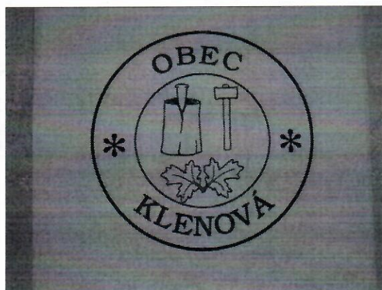
Pečať obce :

2/9 bielej 1/9, zelenej 2/9, žltej 1/9, zelenej 2/9 a žltej 1/9.