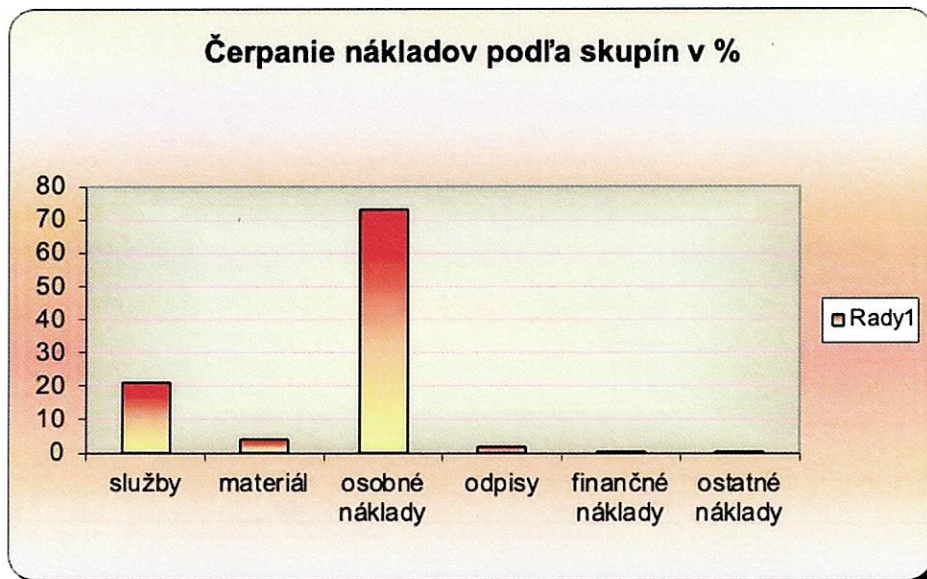
Čerpanie nákladov graf č.3

Spoločnosť nevykladá prostriedky na výskum a v rámci vývoja novej aplikácie na zefektívnenie skladového hospodárstva vynaložila v priebehu roka 30 000,-EUR