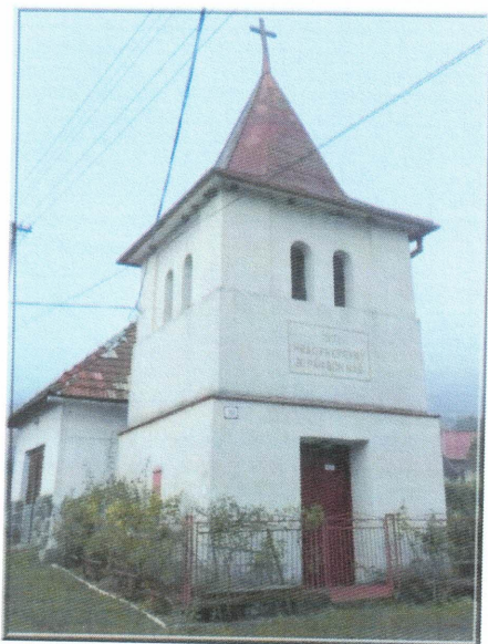
Požiarňa zbrojnica zrekonštruovaná v roku 2020