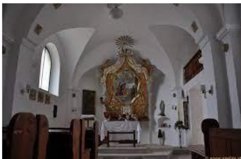
pohľad na oltár