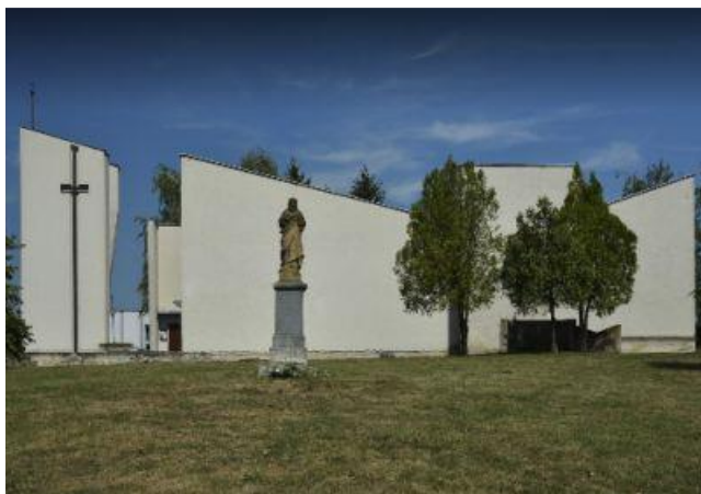
Moderný rímsko-katolícky Kostol svätého Pia X. bol postavený v 20.storočí

Kostolík sv. Štefana kráľa je fakt pekný, čistý, nachádza sa v ňom veľa zaujímavých predmetov. Kostolík má dva chóry s dreveným zábradlím, ku ktorým vedú drevené schodíky.