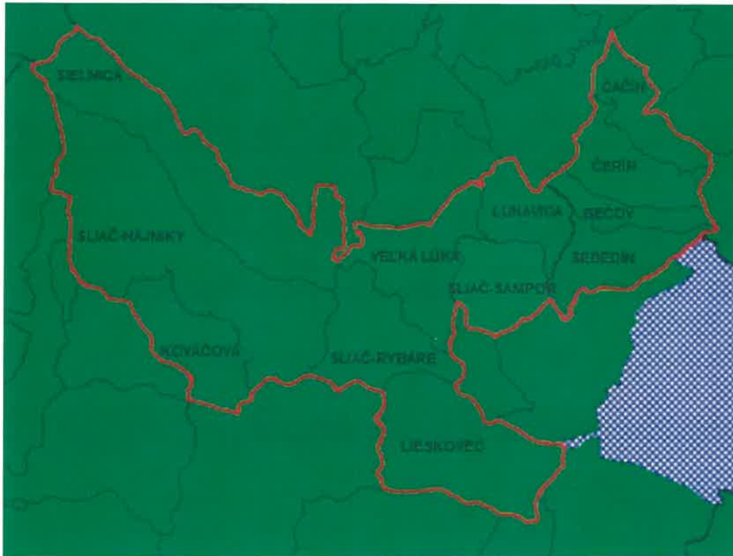
OZ NAŠA LIESKA – mapa členov

Členské obce NAŠA LIESKA sú: Lieskovec, Sliač, Čerín Sebedín – Bečov, Lukavica, Veľká Lúka, Kováčová, Sielnica. Sídлом verejno-súkromného partnerstva je obec Lieskovec.