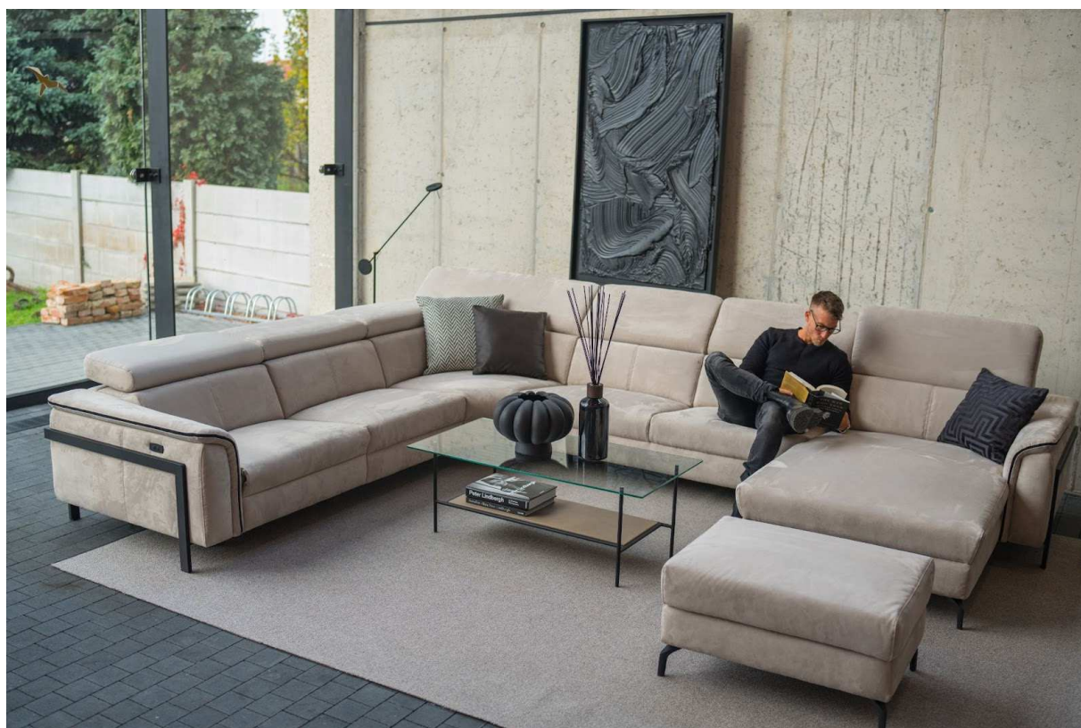
* model Tycan

V roku 2021 sme vyvzorovali a začali vyrábať pre holandského zákazníka, firmu Habufa, model Tycan. Počas roka 2022 sa úspešne predával a samotné objednávky tohto modelu vystúpali na 18 % z celkových objednávok tohto odberateľa, tj. z priemerne 230 elementov týždenne.