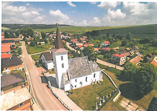
Rímskokatolícky kostol sv. Kataríny