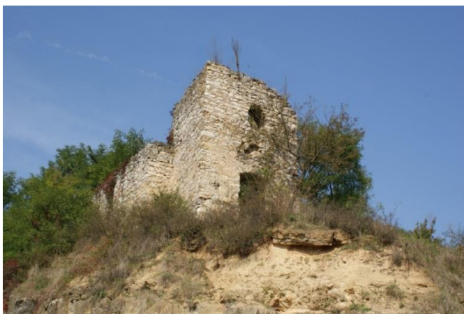
Kaplnka Andreja apoštola

Najvýznamnejšou pamiatkou obce je kaplnka sv. Andreja apoštola postavená v eklektickom historizujúcom slohu. Nachádza sa na skrasovatenom brale nad miestnou základnou školou.