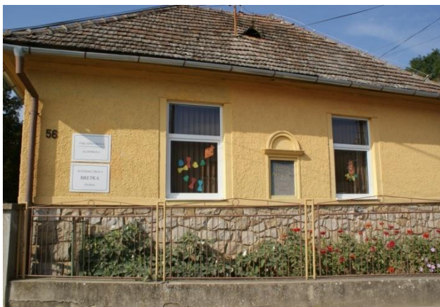
Budova školy a škôky

Na základe analýzy doterajšieho vývoja možno očakávať, že rozvoj vzdelávania sa bude orientovať na skvalitňovanie výchovno – vzdelávacieho procesu.