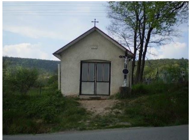
kaplnka sv. Jána Nepomuckého