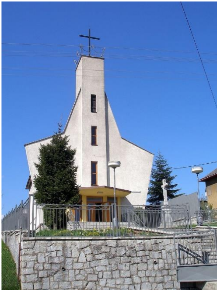
Kostol Krista Kráľa