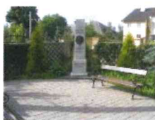
Pamätník sa nachádza v areáli Dolného kaštieľa

Juraj (György) Lahner (* 22. október 1795 Necpaly, † 6. október 1849 Arad (Rumunsko)) jeden z generálov uhorskej revolúcie v roku 1848. Popravený spolu s ďalšími v Arade, v maďarskej literatúre spomínaní ako Aradskí mučeníci