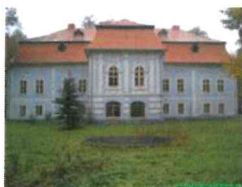
Stav v roku 2002

Dátum vzniku tohto kaštieľa nie je presne známy, z hľadiska stavebného vývoja a slohového zaradenia sa jedná o budovu, ktorá vznikla zo staršej renesančnej stavby, datovanej do 17. storočia, prestavanej a prefasádovanej v 2. polovici 18. storočia do dnešnej barokovo-klasicistickej podoby.