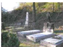
Nachádzajú sa na miernom terénnom vyvýšení za tzv. Franklinovským kaštieľom.