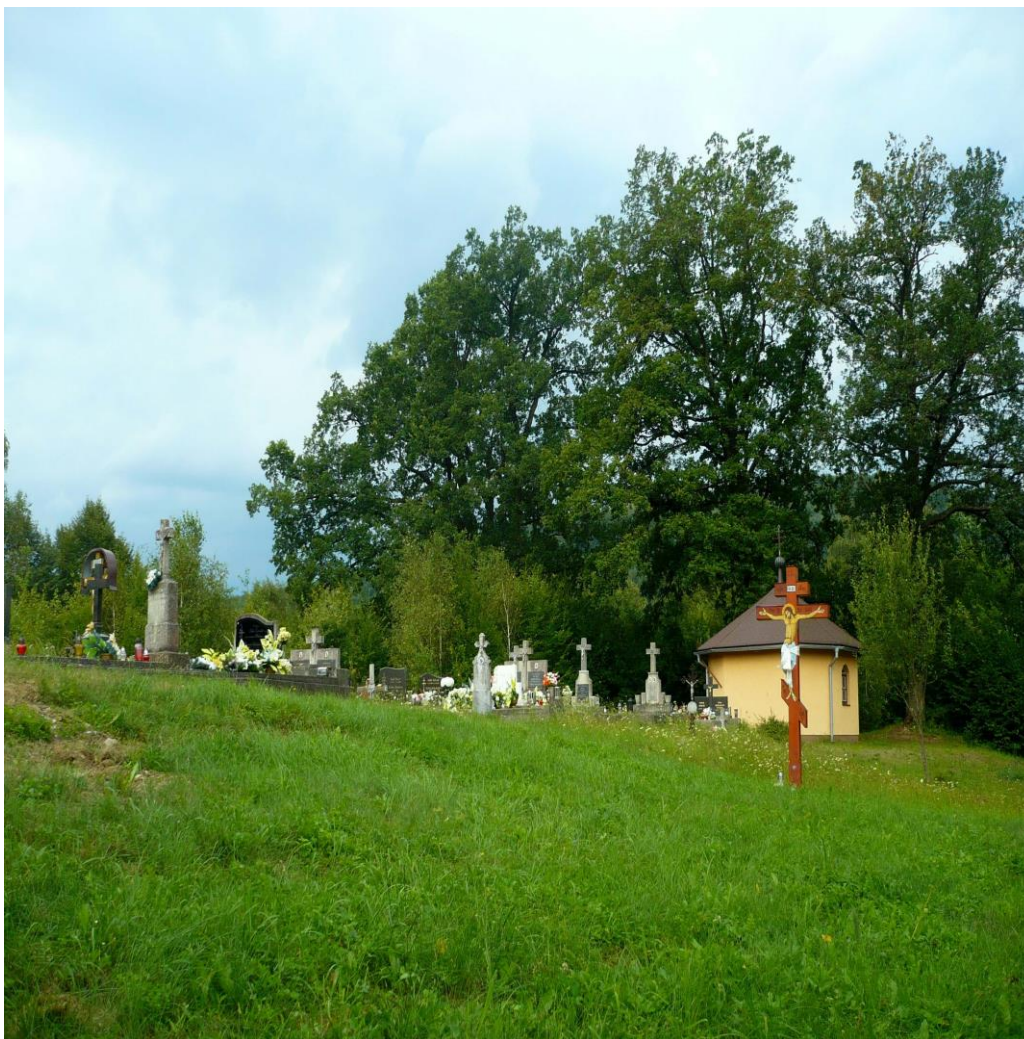
Obrázok 4 Vojnové pohrebisko z 1. svetovej vojny