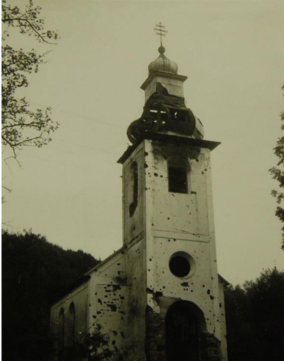
Obrázok 1 Vojnou zničený gréckokatolícky chrám sv. veľkomučeníka Dimitrija Solúnskeho