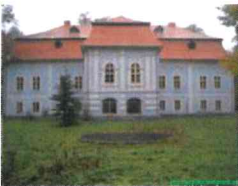
Stav v roku 2002

Dátum vzniku tohto kaštieľa nie je presne známy, z hľadiska stavebného vývoja a slohového zaradenia sa jedná o budovu, ktorá vznikla zo staršej renesančnej stavby, datovanej do 17. storočia, prestavanej a prefasádovanej v 2. polovici 18. storočia do dnešnej barokovo-klasicistickej podoby.