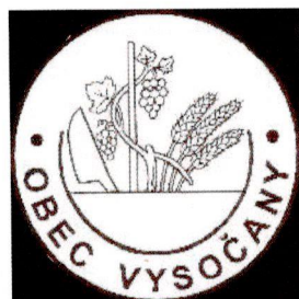
Pečať obce :