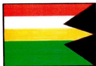
Vlajka obce :