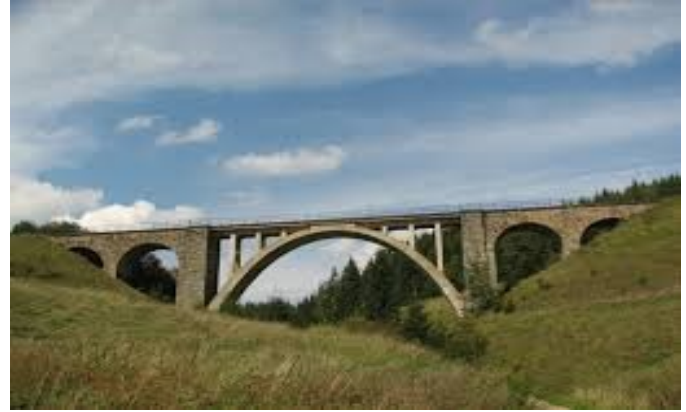
Telgártsky viadukt – súčasť Telgártskej slučky