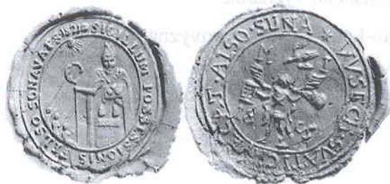
Obecné pečate z 19.storočia