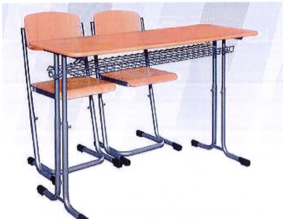
OBRÁZOK - ILUSTRÁČNÝ OBRÁZOK OBJEDNANÉHO NÁBYTKU