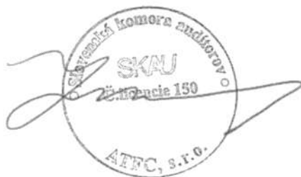
ATFC, s.r.o., Bratislava Licencia SKAu č. 150