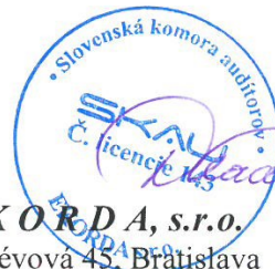
E K O R D A, s.r.o. Révová 45, Bratislava Licencia SKAU 143