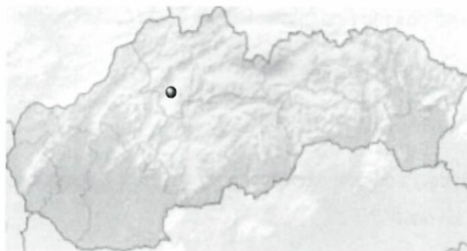
Poloha obce na Slovensku