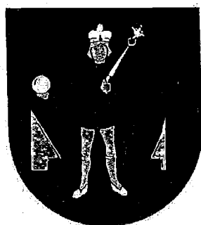
Znak obce Močidl'any

Močidl'any sa roku 1392 spomínajú od menom MOCHILAN. Patrili rovnako ako Popudiny k panstvu Holíč a v rokoch 1730 – 1773 Skalickým jezuitom a potom Habsburgovcom. V 18. storočí sa obec nazývala CZOBORFALVA. Roku 1715 mala obec desať poddanských a trinásť želiarskych domácností, roku 1828 64 domov a 520 obyvateľov. Znak obce Močidl'any je tvorený modrým štítom, kde sa na zelenej pažiti nachádza strieborná postava sv. Štefana v červenom kabátcí, v strieborných nohaviciach a zlatých topánkach, so zlatou korunou na hlave a zlatým jablkom a žezlom v rukách. Po stranách strieborný lemeš a čerieslo. Tento znak pochádza z pečatidla z roku 1777.