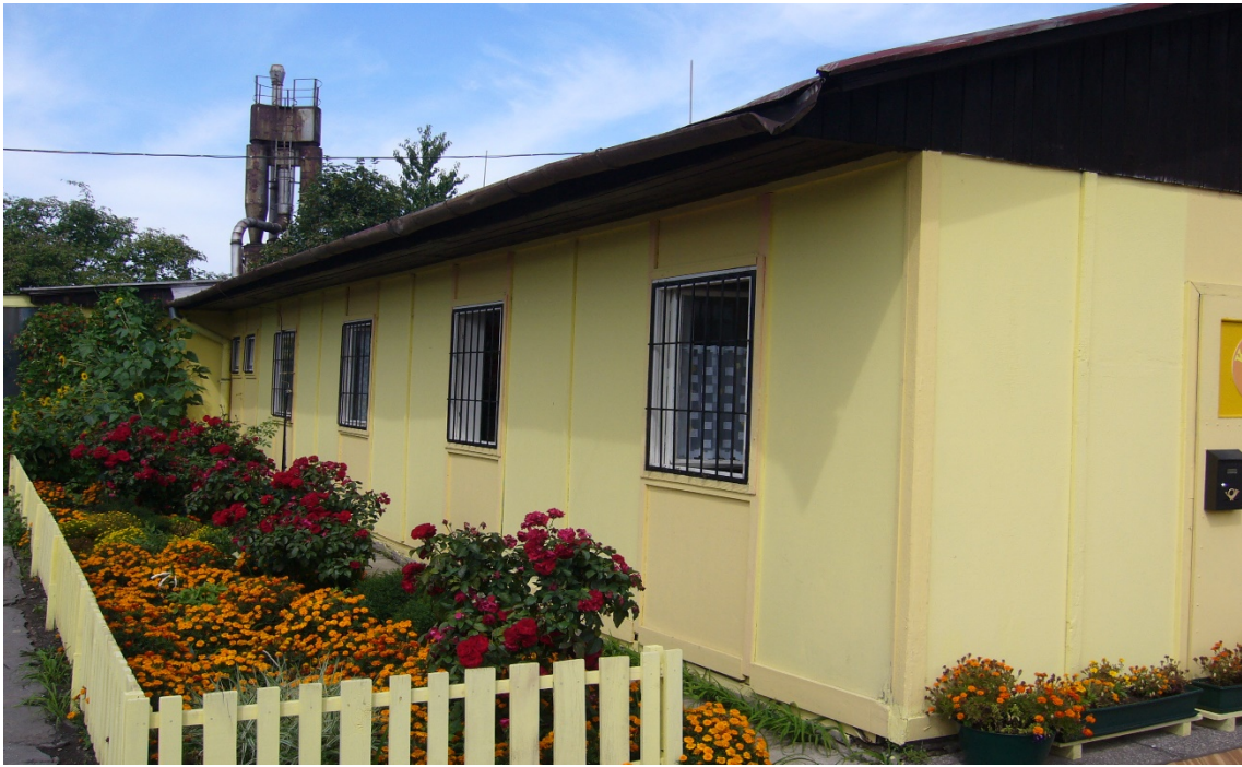
Prevádzková budova KRUH, n. o.