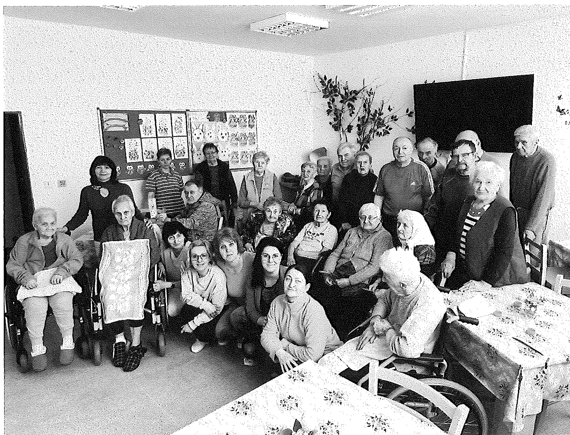
Zelený štvrtok v Barborke