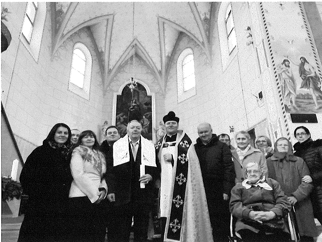
Prijatie sviatosti krstu prijímateľa sociálnej služby