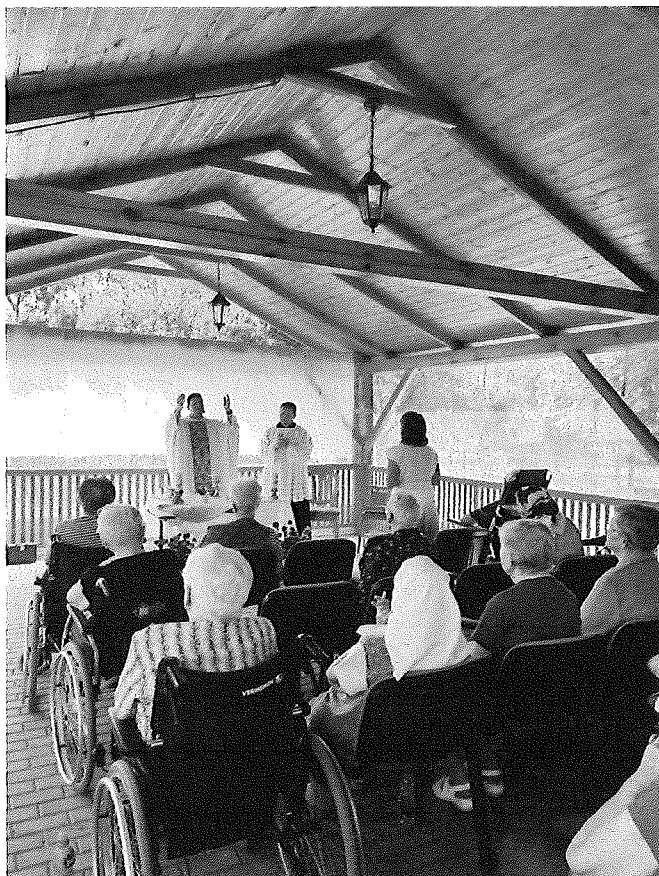
Svätá omša pod altánkom zariadenia