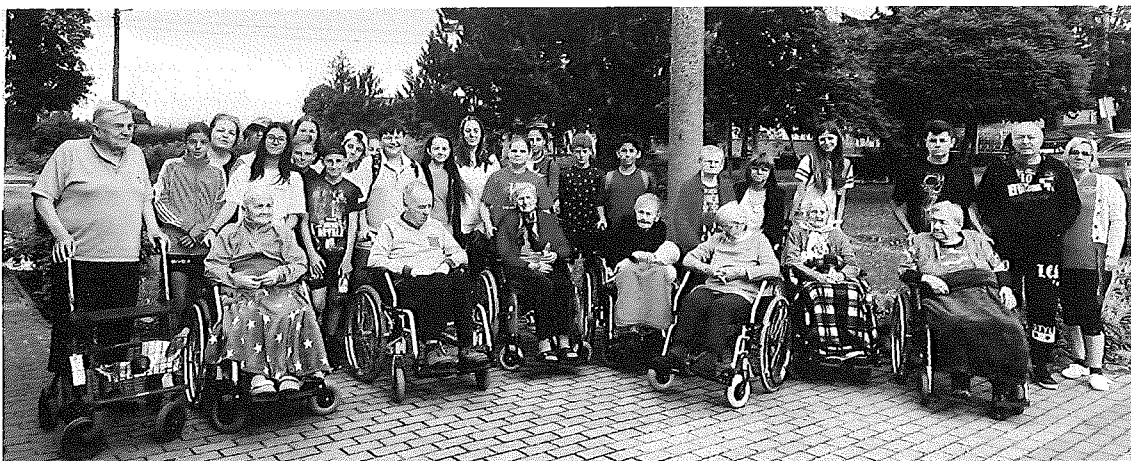
Prechádzka po dedine s deťmi ZŠ Unín