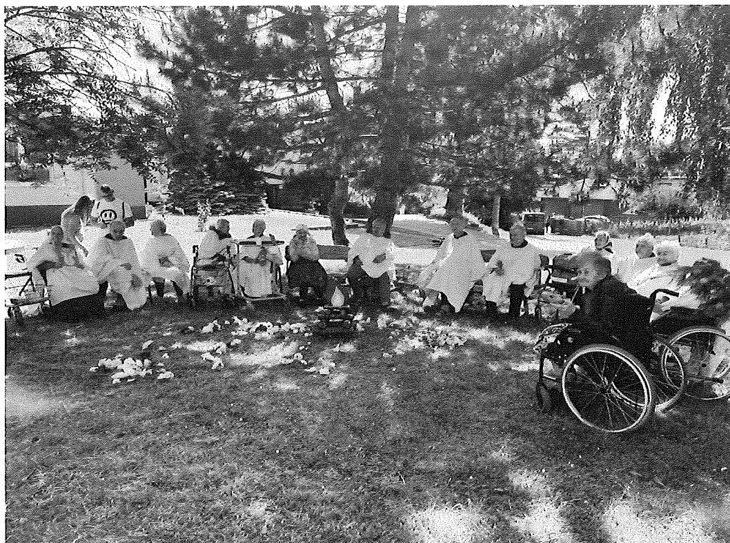
Akcia organizovaná obcou k MDD