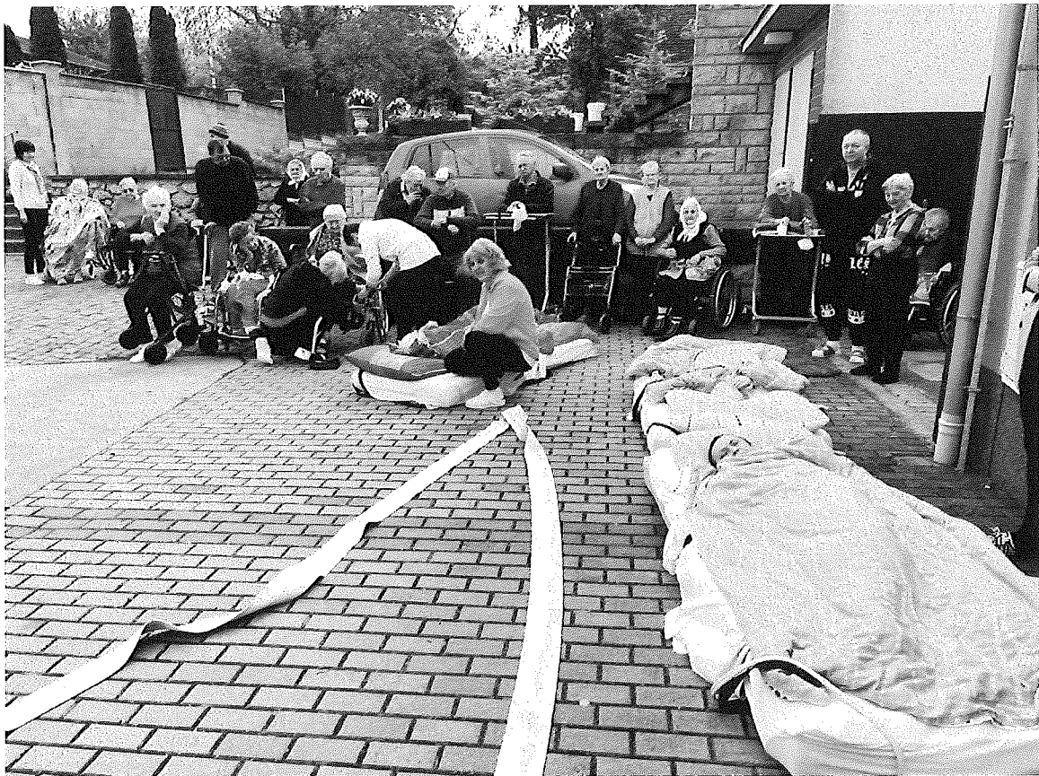
Protipožiarne a evakuačné cvičenie