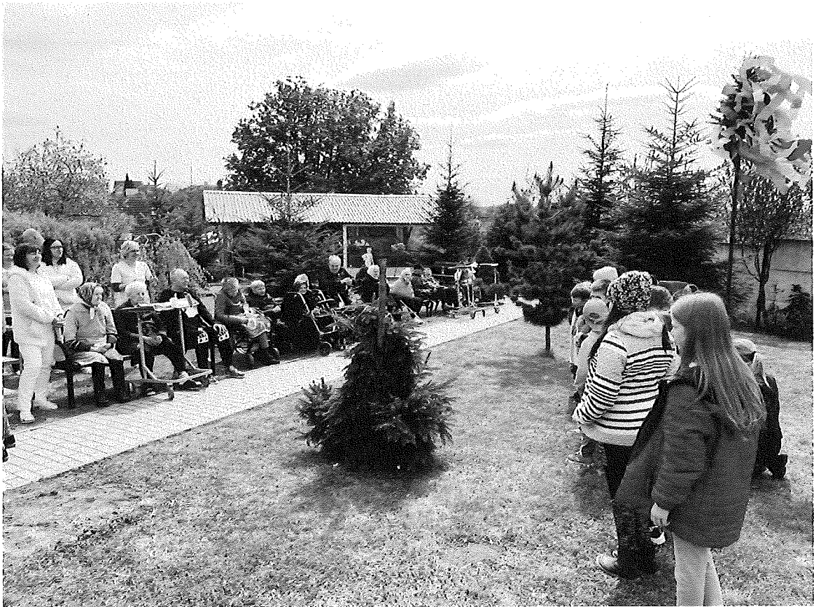
Stavanie májky s deťmi zo školského klubu