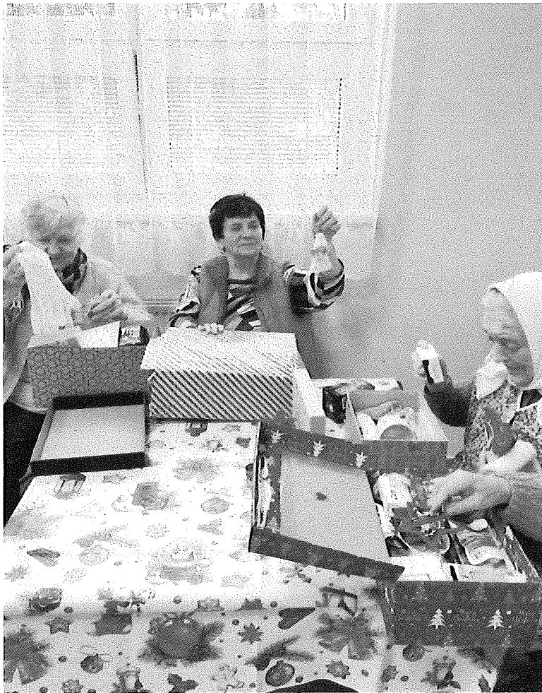
Rozbaľovanie darčiek z projektu „Koľko lásky na zmestí do krabice od topánok“