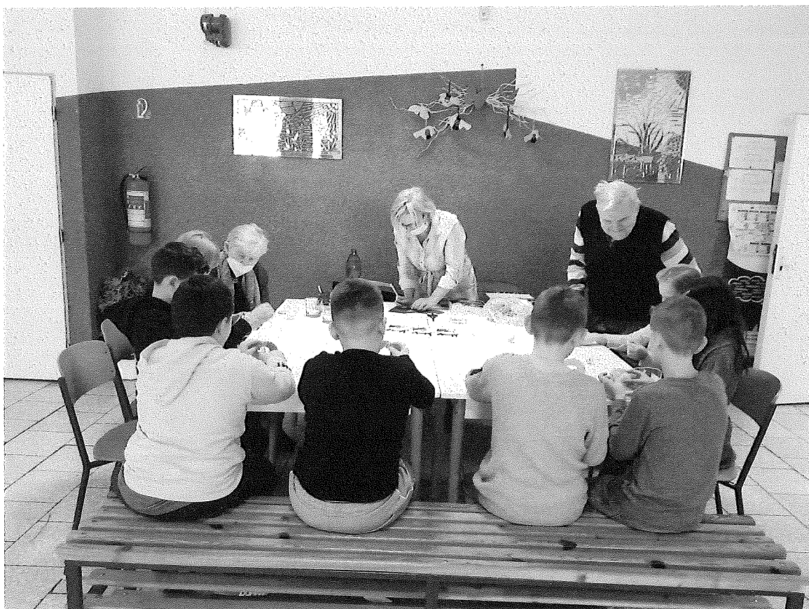
Dielničky v ZŠ Unín