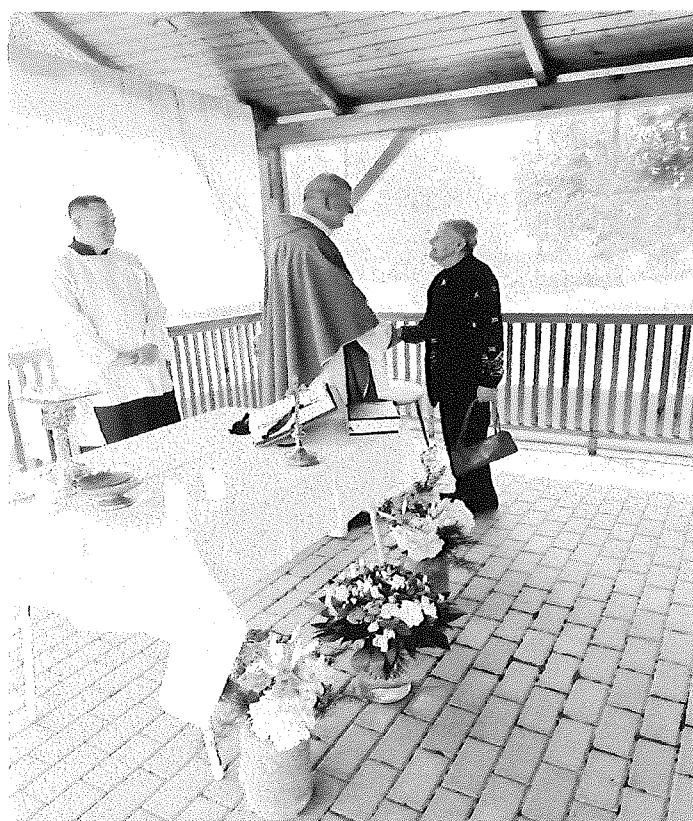
Svätá omša pod altánkom zariadenia