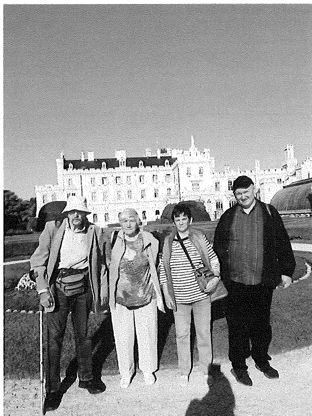
Výlet do moravskej Lednice v spolupráci s Jednotou dôchodcov Unín