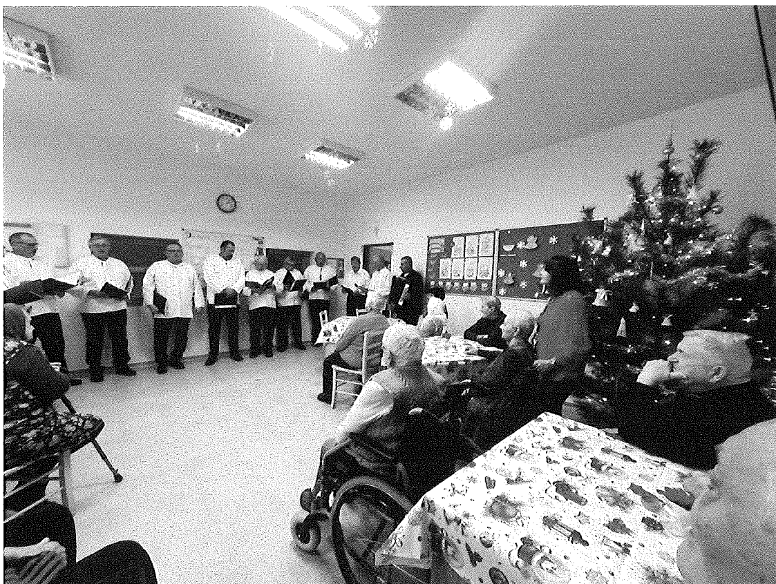
Vianočné vystúpenie „Mužákov z Unína“