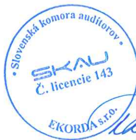
E K O R D A, s.r.o. Révová 45, Bratislava Licencia SKAU 143