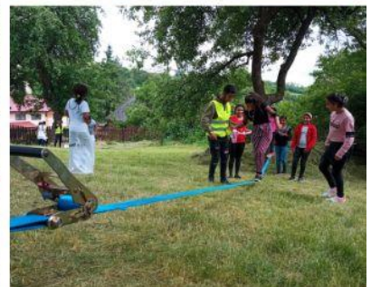
Deň rodiny 2023