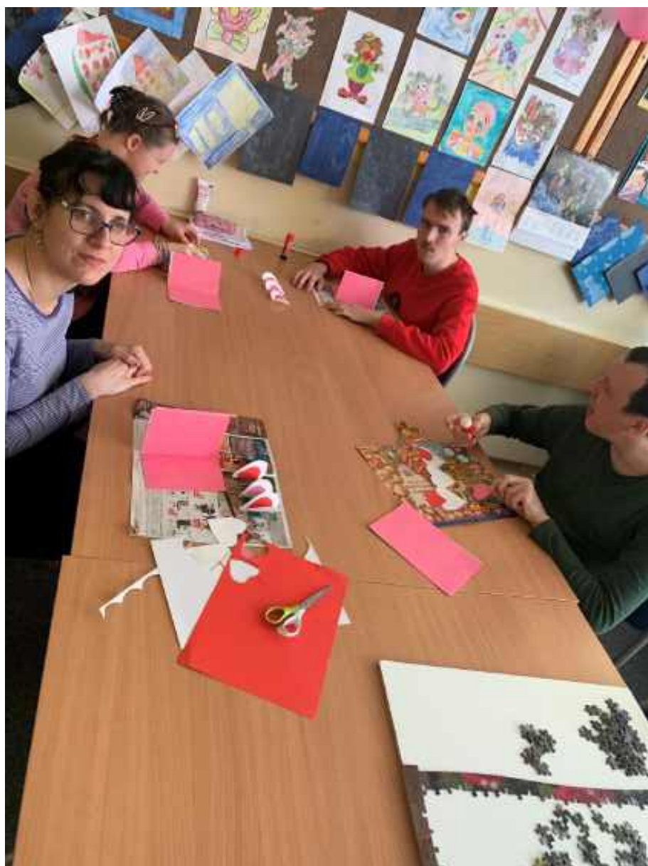
Príprava pohľadnice na Valentína 2023