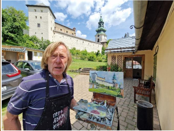
Komunitní deň s burzou