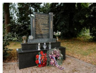
Spomienkovú slávnosť pri príležitosti SNP