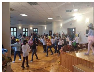
Október - mesiac úcty k starším

deťom Mikuláša a jubilujúcim občanom nad 70 rokov veku posedenie pred Vianocami.