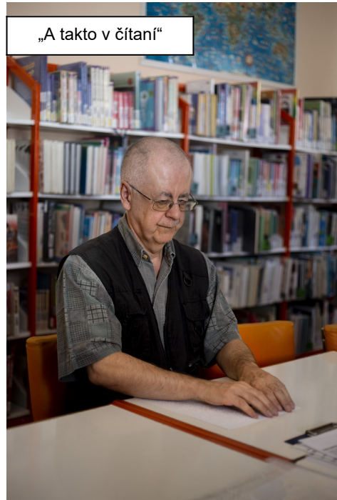
„A takto v čítaní“