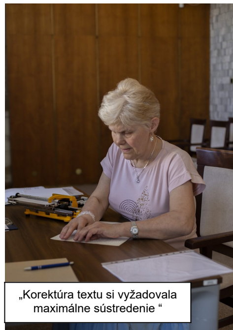
„Korektúra textu si vyžadovala maximálne sústredenie“