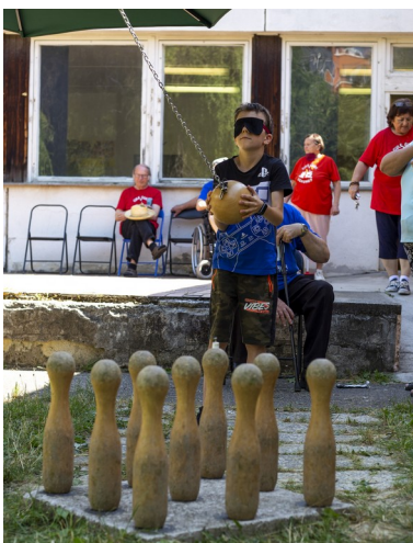
„Najväčší záujem vzbudil turnaj v ruských kolkoch.“