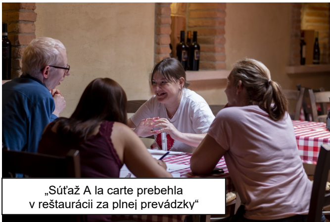
„Súťaž A la carte prebehla v reštaurácii za plnej prevádzky“