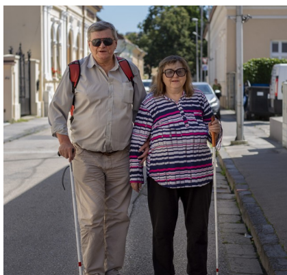
„A tak to sa putovalo za súťažami“