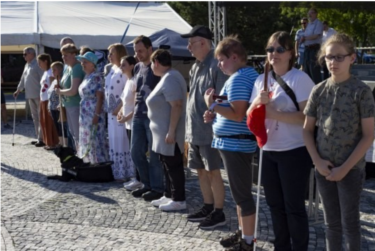
Účastníci Tour de Braille Nitra 2023