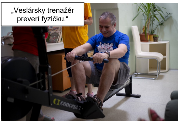
„Veslársky trénažér preverí fyzičku.“