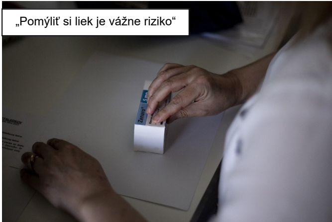
„Pomýliť si liek je vážne riziko“