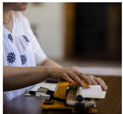
„Písanie na stroji Tatrapoint“