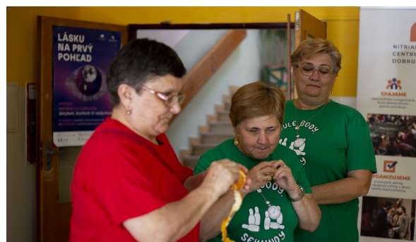
„Kuriozitou súťaž o najdlhšiu šúpu z mandarínky.“