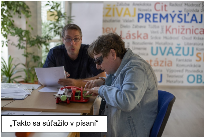
„Takto sa súťažilo v písaní“