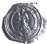
Naplnená pečať obce

Pečať obce: Obec Slovenská Ves, hoci nebola mestom ani mestečkom, mala svoju kancelársku činnosť už od 16. storočia. Dôkazom toho je jej pečať, ktorá pochádza z tohto obdobia. V pečati je vyobrazená patrónka obce panna Mária s Dieťaťom na pravej ruke, stojaca na polmesiaci, v pozadí so svätožiarou. Mala priemer 2,8 cm a kruhový opis. S.DES MITELS VINCZENDORF (pečať mestečka Slovenská Ves)