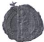
Pečať „mestečka“ Slovenská Ves