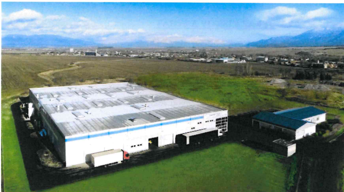
Spoločnosť pred spustením výroby v roku 2015.